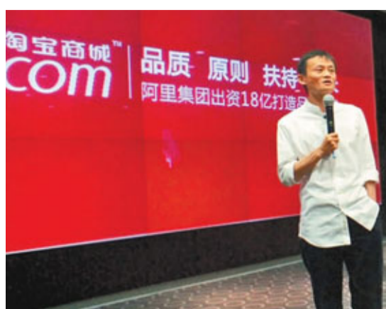
阿里巴巴主席馬雲宣佈, 有關淘寶商城的新規延至明年9月30日執行, 新商家1月1日起執行。

他表示, 雅虎對阿里巴巴很重要, 自己對雅虎的興趣也沒有改變過。「如果能做什麼, 我們當然希望做, 今天不能講怎麼做, 以後給大家講講怎麼做。」