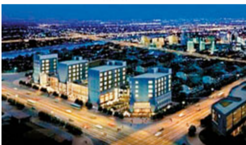
朝陽區十大發展基地之七：