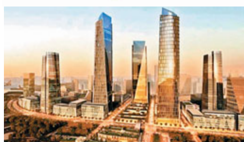
朝陽區十大發展基地之八：