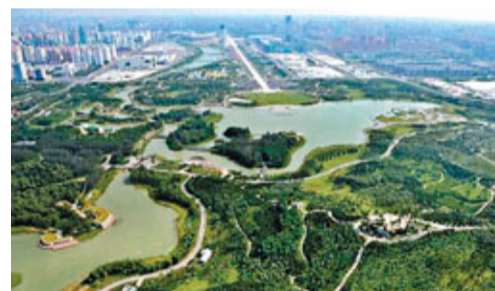
朝陽區十大發展基地之十：