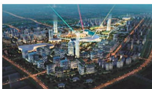
朝陽區十大發展基地之九：