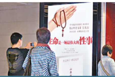
■廣告牌引來路人圍觀。

繼9月北京使用小學生性教育課本《成長的腳步》引發關注後，近日，一幅突出「性事」兩字的廣告，驚現北京白領川流不息的CBD核心國貿地鐵站裡，頻頻可見年輕人對這一廣告駐足圍觀或拍照。更令人驚訝的是，不少圍觀者表示這則廣告並非不可以接受，甚至認其廣告語的「生命是一場偉大的性事」很有內涵。