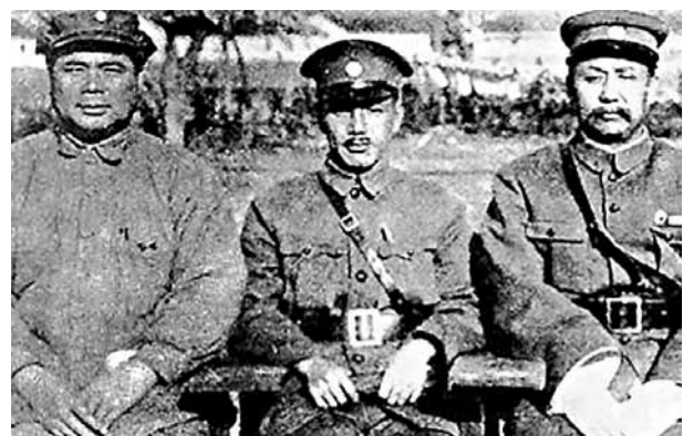
■(左起)馮玉祥、蔣介石與閻錫山。

「從貧寒的農家子成長為叱咤沙場的愛國將領，從一名舊軍人轉變為堅定的民主主義戰士，爺爺每一步都走得不尋常。」雖然與祖父從未謀面，但馮丹龍覺得，這位濃眉大眼、率直博愛的爺爺，離她並不遠。隨着對爺爺的了解日深，爺爺的每一次痛苦踟躕、每一次義無反顧，她似乎都能感同身受。