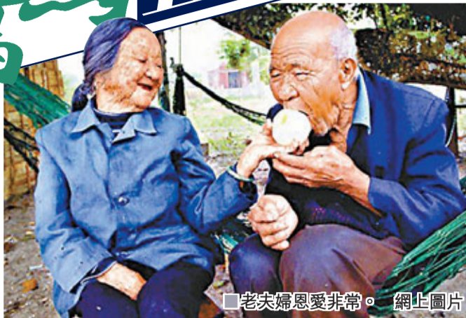
■老矣婦恩愛非常。

「京族」，歷史上曾被稱為「安南」、「越族」，是中國唯一一個海濱漁業少數民族，現有一萬多人，大都生活在號稱「京族三島」的廣西東興市江平鎮的巫頭村、滿尾村和竹山村。