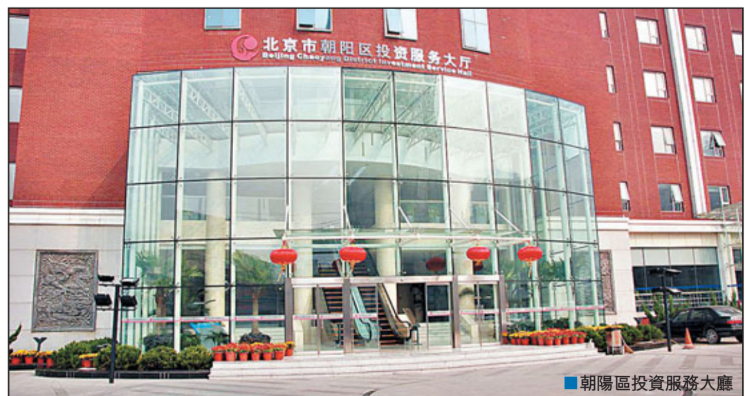
朝陽區投資服務大廳

在完善政策的同時，朝陽區不斷規範政府服務，營造良好的政務環境。早在2000年，朝陽區就成立了面向企業和社會服務的「一站式」投資服務大廳，方便企業辦理各項業務。截至2010年底，服務大廳共審批內資企業14.5萬家，外資企業5117家，入資總額達623.59億元。此外，朝陽區積極服務於企業和項目落戶，特別是推進行政審批制度改革，開闢企業註冊和投資的綠色審批通道，擴大網上審批範圍。目前，已經取消各類審批事項83項，3日內完成審批的項目達到60%以上。為了響應北京市政府擴大內需的號召，朝陽區同時也設立了重大項目綠色審批通道。兩條綠色通道有效提高了行政審批效率，企業和項目落戶工作變得更加方便、快捷。