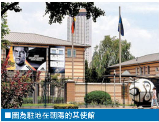
圖為駐地在朝陽的某使館