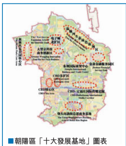
朝陽區「十大發展基地」圖表

朝陽區位於北京市城區東部，是首都城市功能拓展區，全區總面積470.8平方公里，常住人口354.5萬人，是北京市面積最大、人口最多的城區。按照新的北京城市總體規劃，朝陽區作為首都城市功能拓展區，被賦予了「國際交往的重要窗口，中國與世界經濟聯繫的重要節點，對外服務業發達地區，現代體育文化中心和高新技術產業基地」的功能定位。經過多年的發展，朝陽區已進入國際化、高端化、內涵式發展的新階段。