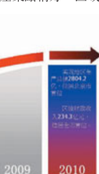
綜合經濟實力圖表

近十年來，地區生產總值年均增長13%，2010年實現2804.2億元，位居北京市首位。2010年區級財政收入完成234.3億元，多年來穩居北京市各區縣首位。全社會固定資產投資、社會消費品零售額分別達到北京市的22.4%和27.9%。實際利用外資、進出口總額均佔全市的40%以上。朝陽區經濟的持續發展得益於市場發育程度高，產業結構好。區域內擁有約25萬家企業，