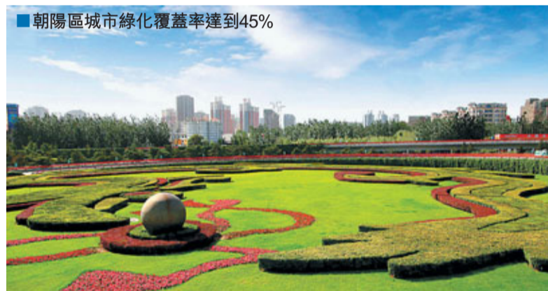
朝陽區城市綠化覆蓋率達到45%

根據《北京市總體規劃（2004年—2020年）》，北京城區將向東拓展。目前，朝陽區仍有2/3的面積屬於農村。到2020年，朝陽區將全面實現城市化，屆時，朝陽區全境將成為北京的CBD。為加快區域城市化進程，從2009年以來，朝陽區陸續啟動了90平方公里的土地儲備工作，其中規劃建設用地面積約39平方公里，為下一步產業和功能區發展提供了廣闊的空間。