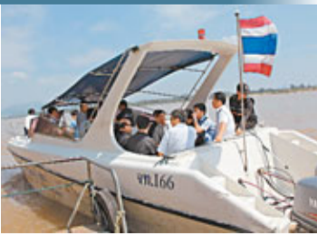
中國政府聯合工作組成員昨登上泰國警方快艇，前往肇事水域進行勘察。

中國政府聯合工作組組長、外交部領事司副司長兼領事保護中心主任郭少春表示，中國領導人對多名中國船員在湄公河遇難身亡事件高度重視，中國民眾和媒體對事件進展十分關注。盡快徹查事件，將兇手繩之以法，中泰雙方和有關國家都責無旁貸。希望泰方繼續保持積極協助中方工作的態勢，全力推進調查工作取