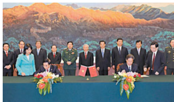
越共總書記阮富仲本月訪華期間與中國共同發表聯合聲明。圖為中越雙邊合作文件的簽署儀式。資料圖片

另一方面，日本首相野田佳彥日前指責稱，中國的「軍力擴張和海軍動向」對日本安全構成「威脅」。對此，劉為民回應稱，中國加強國防和軍隊現代化建