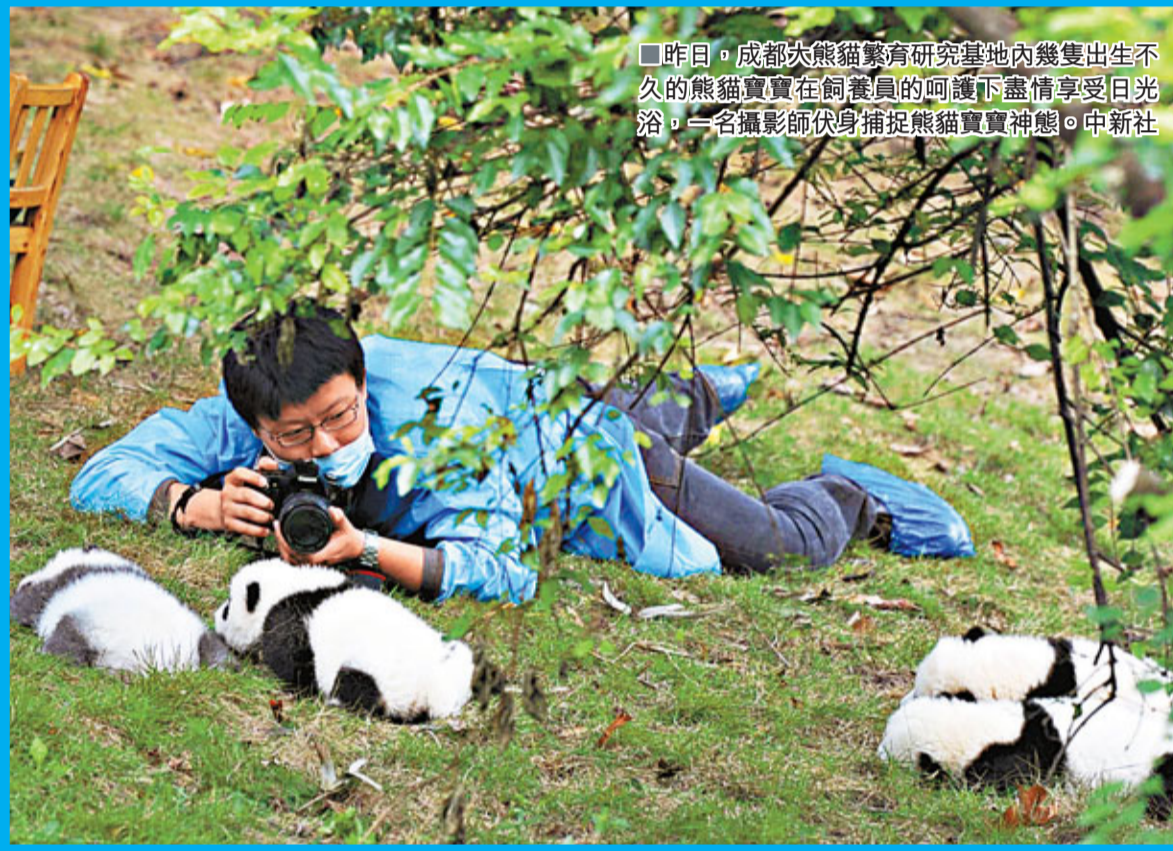
昨日，成都大熊貓繁育研究基地內幾隻出生不久的熊貓寶寶在飼養員的呵護下盡情享受日光浴。一名攝影師伏身捕捉熊貓寶寶神態。

報道指出，1972年為紀念中日邦交正常化，中國向東京上野動物園贈送了2隻大熊貓。2000年為祝願阪神大地震災後重建，中方應神戶市的請求向該市王子動物園租借了2隻大熊貓。其中1頭取名為「興興」，其寓意為復興。