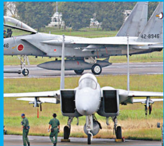
日本航空自衛隊F-15戰機。資料圖片

報道認為，雖然仙台市政府已正式開始與中國有關部門和野生動物保護協會展開磋商，但是日本政府的支持至關重要。仙台市方面還通過前自民黨幹事長加藤紘一等「中國通」議員展開斡旋，希望能夠促成此事。