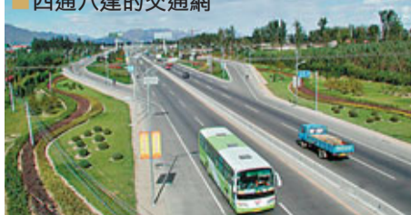
■四通八達的交通網