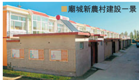
■廟城鎮新農村建設一景