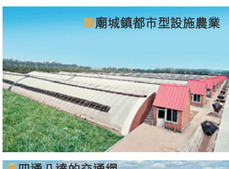
■廟城鎮都市型設施農業

今天的廟城鎮，氣象萬千，日新月異。那麼，再過五年，廟城鎮將會是什麼樣子？「十二五」規劃又將有怎樣的舉措呢？