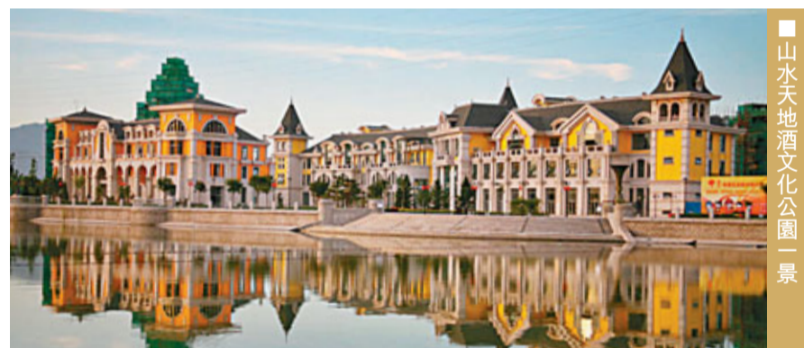
■山水天地酒文化公園一景

未來的廟城，是一幅美麗的圖畫，全新的「北京」速度下，將打造出全新的面貌。「兩區兩翼」和「一主兩輔」，便是該鎮未來五年基本的規劃格局。