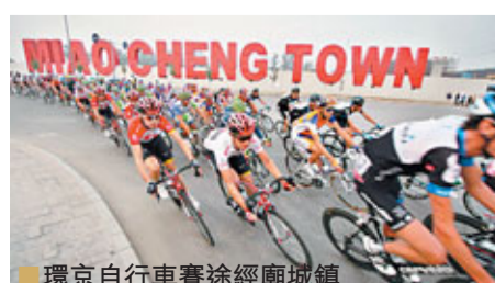
■環京自行車賽途經廟城鎮

娛、西居」的汽車產業發展新格局。廟城鎮通過福田歐曼重卡汽車項目，能順勢打造出南部現代製造業發展集聚區，發展高效的北部汽車物流貿易區，高標準建設沿懷河娛樂景觀帶，以點帶面建設西部宜居新區，並解決大量的就業問題，意義重大而深遠。