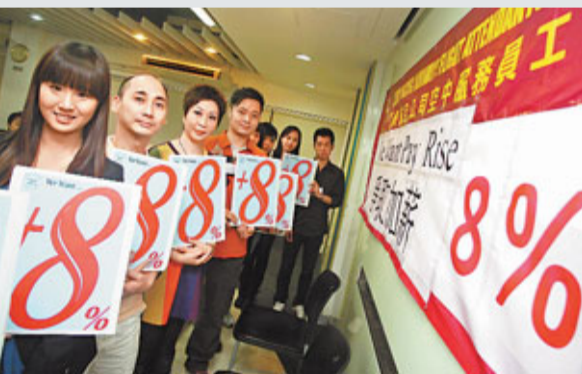
國泰空中服務員工會表示，因應通脹持續高企，要求加薪8%，追及通脹率。

至於施政報告提出延續3,000個青少年臨時職位，張建宗稱要視乎社福機構的實質需要而延續相關職位，而勞工處會透過現有的青見及展翅計劃，繼續協助有需要的青少年。對於社會有人士要求推出全民退休保障，張建宗表示，中央政策組正進行相關研究，亦可能優化強積金制度，加強保障市民。