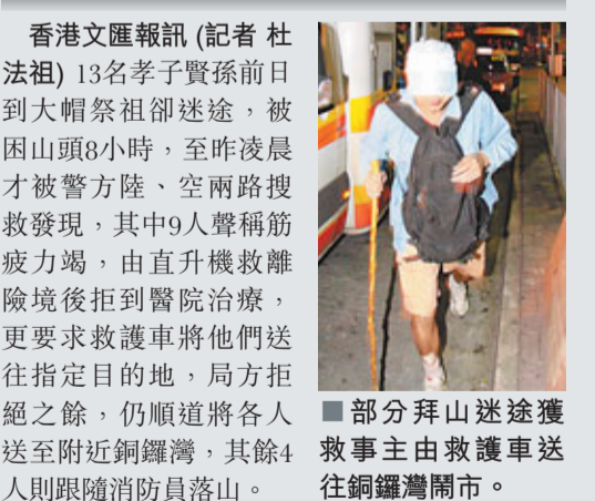
部分拜山迷途獲救車主由救護車送往銅鑼灣鬧市。