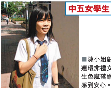
中五女學生陳小姐對連環非禮女生色魔落網感到安心。