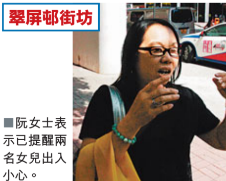
阮女士表示已提醒兩名女兒出入小心。