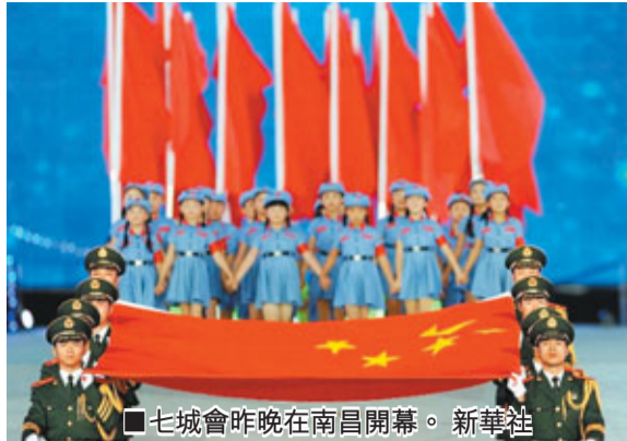
七城會昨晚在南昌開幕。