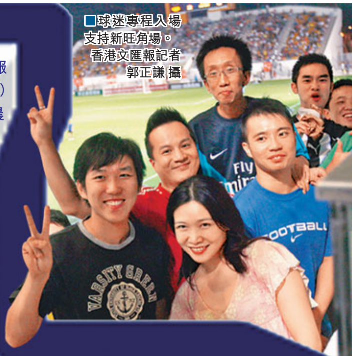
■球迷專程入場支持新旺角場。

香港文匯報訊（記者 郭正謙）日之泉JC晨曦（晨曦）大破深水埗賀新旺角場登場！憑藉巴利大演「帽子戲法」，晨曦16日在旺角大球場舉行的bma甲組足球聯賽中，以5球大破深水埗，「加強版」旺角場首度亮相港甲即吸引4,499名球迷入場觀戰，大部分球迷均「畀Like」，大讚加強版球場設施完善，不辱「港甲聖地」的金漆招牌。