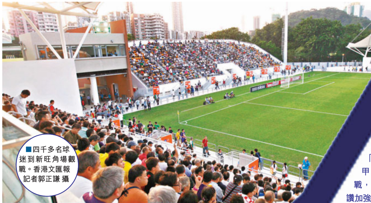
■四千多名球迷到新旺角場觀戰。