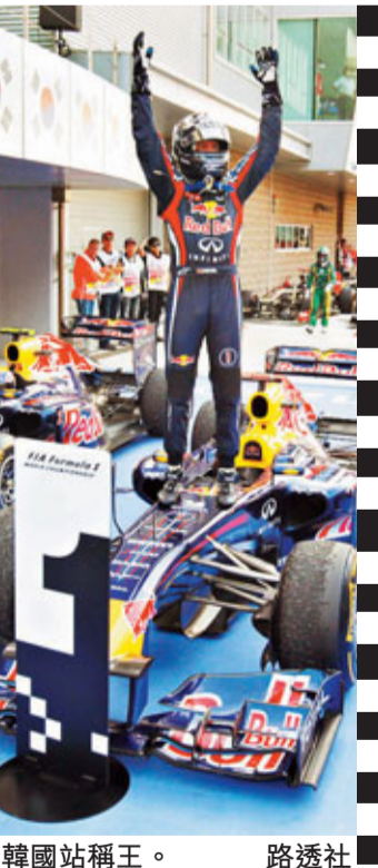
■維泰爾韓國站稱王。

16日，2011賽季F1韓國大獎賽在靈岩賽道結束，紅牛車隊車手維泰爾獲得今季第10站冠軍，麥拿倫的威美頓和紅牛車隊韋伯分列2、3位；紅牛車隊在本站過後提前贏得2011賽季的車隊總冠軍，衛冕成功。