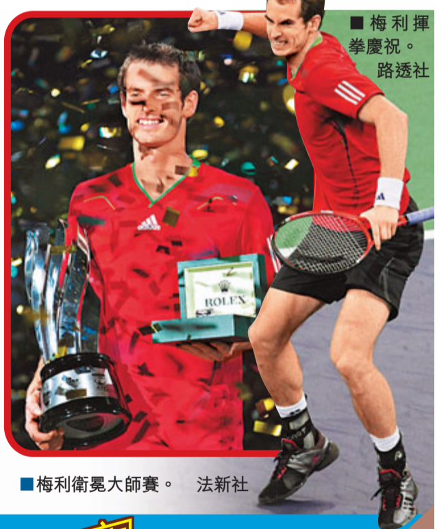
■梅利揮拳慶祝。