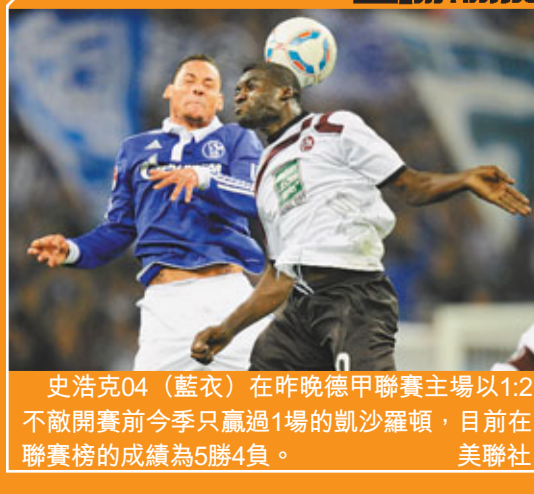
史浩克04(藍衣)在昨晚德甲聯賽主場以1:2不敵開賽前今季只贏過1場的凱沙羅頓，目前在聯賽榜的成績為5勝4負。