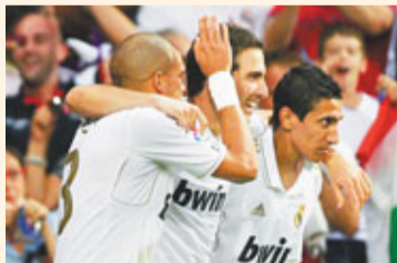
迪馬利亞(右)助攻，希古恩(中)入球。

皇家馬德里與巴塞羅那在本港時間周日凌晨的第7輪西甲聯賽未有受上週的國際賽期所影響，均順利全取三分，其中兩名阿根廷國家隊射手前鋒齊齊有搶鏡的演出。