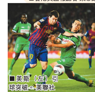
美斯(左)引球突破。