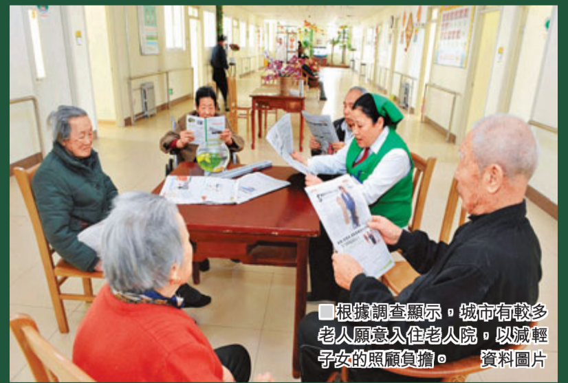
■根據調查顯示，城市有較多老人願意入住老人院，以減輕子女的照顧負擔。 資料圖片