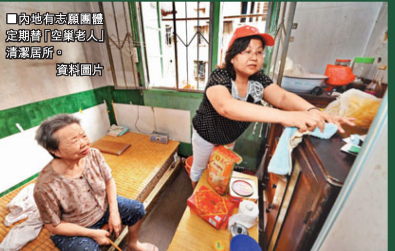
■內地有志願團體定期替「空巢老人」清潔居所。 資料圖片

隨着農村「空巢老人」的逐漸增多及傳統家庭養老功能的逐漸弱化，必然走向社會養老模式。但目前農村社會養老模式尚未成熟，傳統觀念尚未轉變，家庭養老仍扮演重要角色。