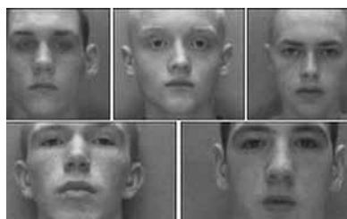
5名被判囚的童黨。網上圖片

英國利物浦本年4月至5月間，10天內接連發生持槍搶劫案，5名童黨手持短獵槍，拉高衣衫遮掩面部，