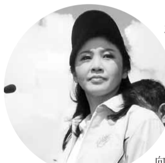
泰國經歷半世紀以來最嚴重水災，當局防災工作見效，未有大量洪水湧入首都曼谷，曼谷目前情況穩定。總理英祿(見圖)向民眾派定心丸，稱他們應該安全，但曼谷周邊多處地方仍遭洪水圍困，曼谷北部有大量工廠被淹沒，威脅仍未解除。

儘管曼谷部分地區前晚下起傾盆大雨，但當局先進的防洪系統發揮作用，渠道及堤壩迅速排洪，避免曼谷遭洪水淹沒。農業部長表示，洪峰已通過曼谷湄南河流入大海，肯定河水水位已過，水位不會高過防洪包。