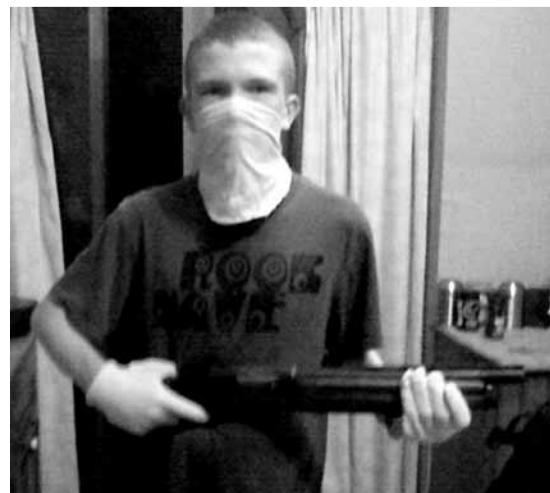
其中一名童黨手持獵槍擺甫士。