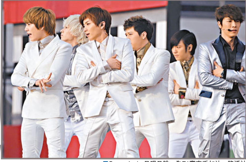
■Super Junior又唱又跳，為F1賽車手加油。

韓國人氣組合Super Junior昨日連趕兩場，先於下午3時20分參加全南靈巖郡舉行的音樂節目《音樂中心》「韓國F1大獎賽」特輯，接着要趕在晚上6時出席在大邱體育場舉行的《2011亞洲音節》，因兩地相隔3至4小時車程，電視台和主辦方特別為他們準備專機往返，認真大手筆。