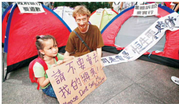
外籍示威者以紙牌:「請不要賣去我的將來」表達不滿。

香港文匯報訊(記者 文森、鄭治祖) 全球多個城市舉辦活動響應紐約「佔領華爾街」行動;香港亦有團體發起「佔領中環」行動,約200人參與。他們聲言要抗議「資本主義」及「金融霸權」導致香港貧富懸殊嚴重。由於是次集會並未向警方申請「不反對通知書」,在場警員發出警告,要示威者離開,但示威者並未理會。不少市民對該批示威者行動不以為然,認為香港與美國情況不相同,是次行動不過是反對派又一次借勢搞一次「政治嘉年華」。