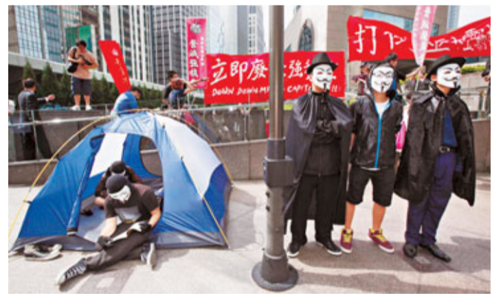
V煞參與「佔領中環」行動。