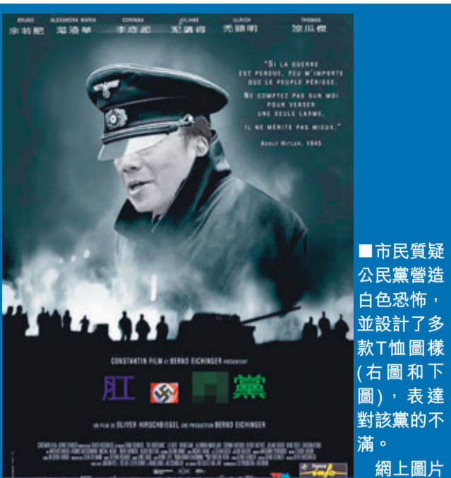
市民質疑 公民黨營造 白色恐怖, 並設計了多款T恤圖樣(右圖和左圖), 表達對該黨的不滿。網上圖片