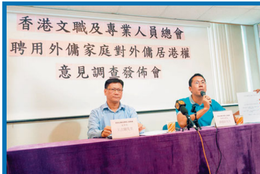
香港文職及專業人員總會調查發現,95%受訪會員反對外傭擁有居港權,並表示憂慮對香港社會帶來民生問題。

香港文匯報訊(記者 鄭治祖) 高等法院就外傭居港權案判特區政府敗訴,令社會各界擔憂,倘若外傭取得居港權,或會對香港人口政策,以至房屋、社福、醫療等帶來沉重負擔。香港文職及專業人員總會調查發現,95%受訪市民反對外傭擁有居港權,擔心他們取得居港權後,對香港社會和經濟帶來嚴重衝擊;85%受訪市民更憂慮外傭擁居港權後在港產子,或為本地公立醫院婦產科帶來壓力。