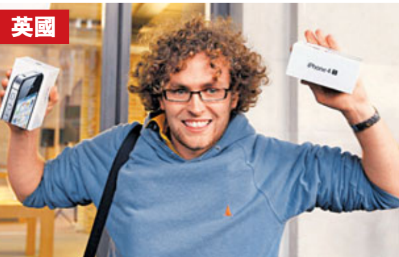
■倫敦一名買家高興iPhone 4S到手。

在澳洲悉尼蘋果專門店外，排頭位的莫斯卡3天前便來到，為向喬布斯表示敬意，辛苦一點也在所不辭。被問到買到iPhone 4S後最先會做什麼時，莫斯卡說，他會打開新加入的「Siri」語音辨識操控軟件，問它：「喬布斯在哪？」