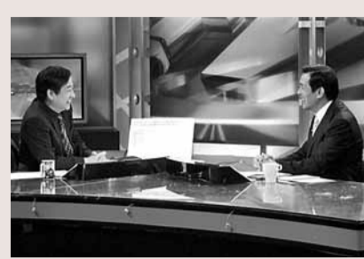
馬英九（右）亮相電視台接受專訪。