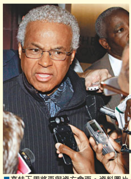
■亨特下周將再與資方會面。

聯邦仲裁與調解局是一個獨立政府機構，09年出任主管的科恩去年曾成功幫助美國足球職業大聯盟(MLS)解決勞資糾紛。