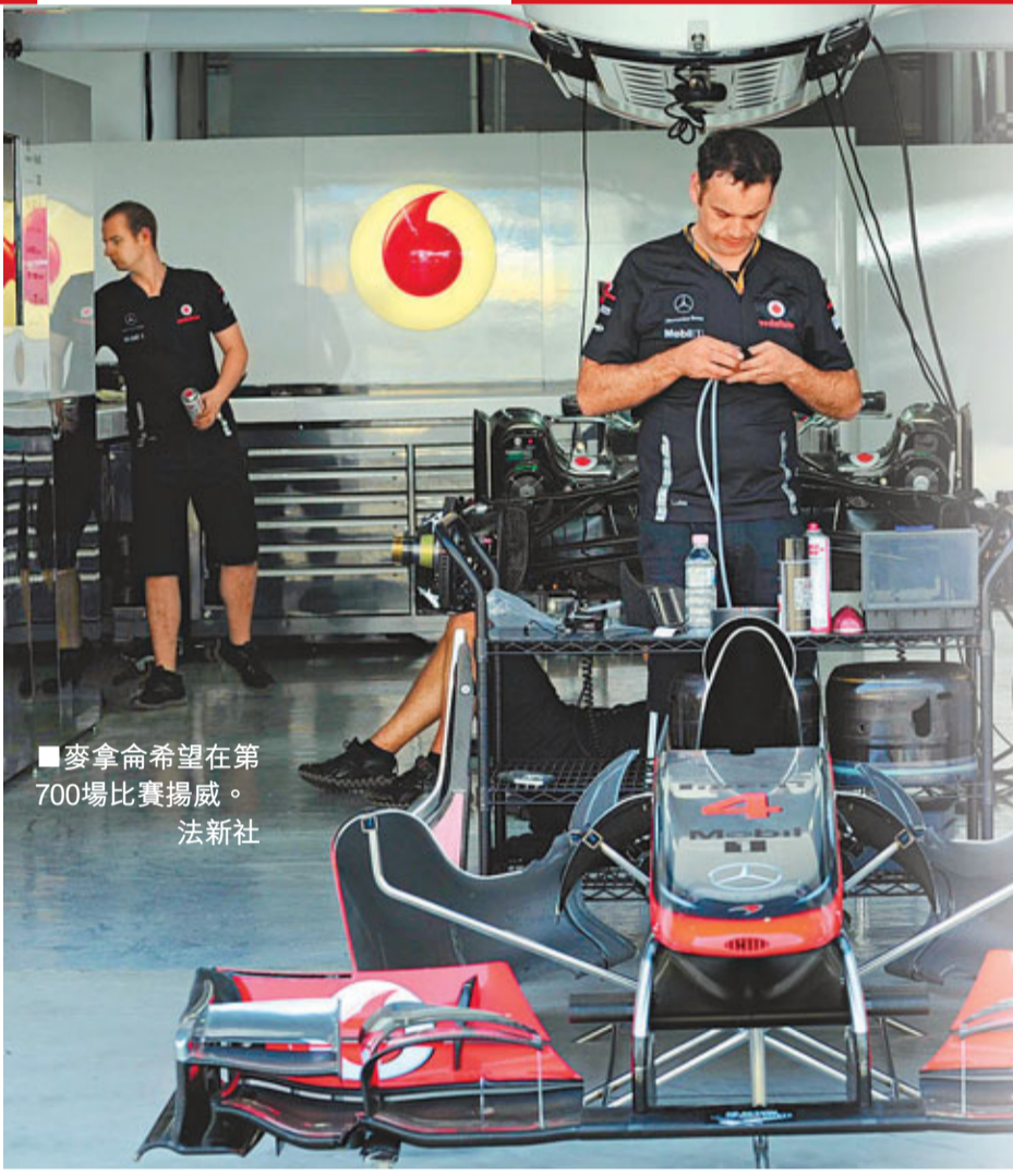
■麥拿命希望能在第700場比賽揚威。

麥拿命車隊在1966年摩納哥站首度亮相，45年來共贏得8次車隊總冠軍、12次車手世界冠軍和174個分站冠軍，周日一戰將是這支老牌勁旅第700場F1賽事，對此韋特馬殊希望一對車手畢頓和威美頓能以首兩名完成。