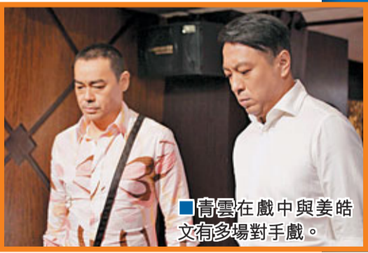
青雲在戲中與姜皓文有多場對手戲。