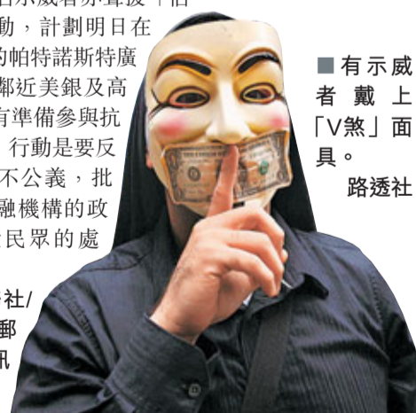
有示威者戴上「V煞」面具。