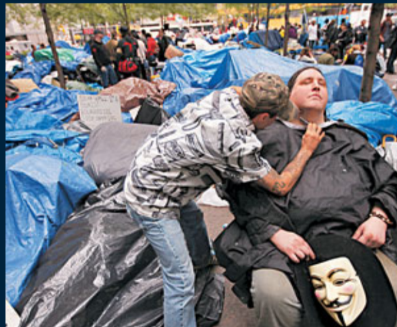
示威者在紐約紮營準備「長期作戰」。