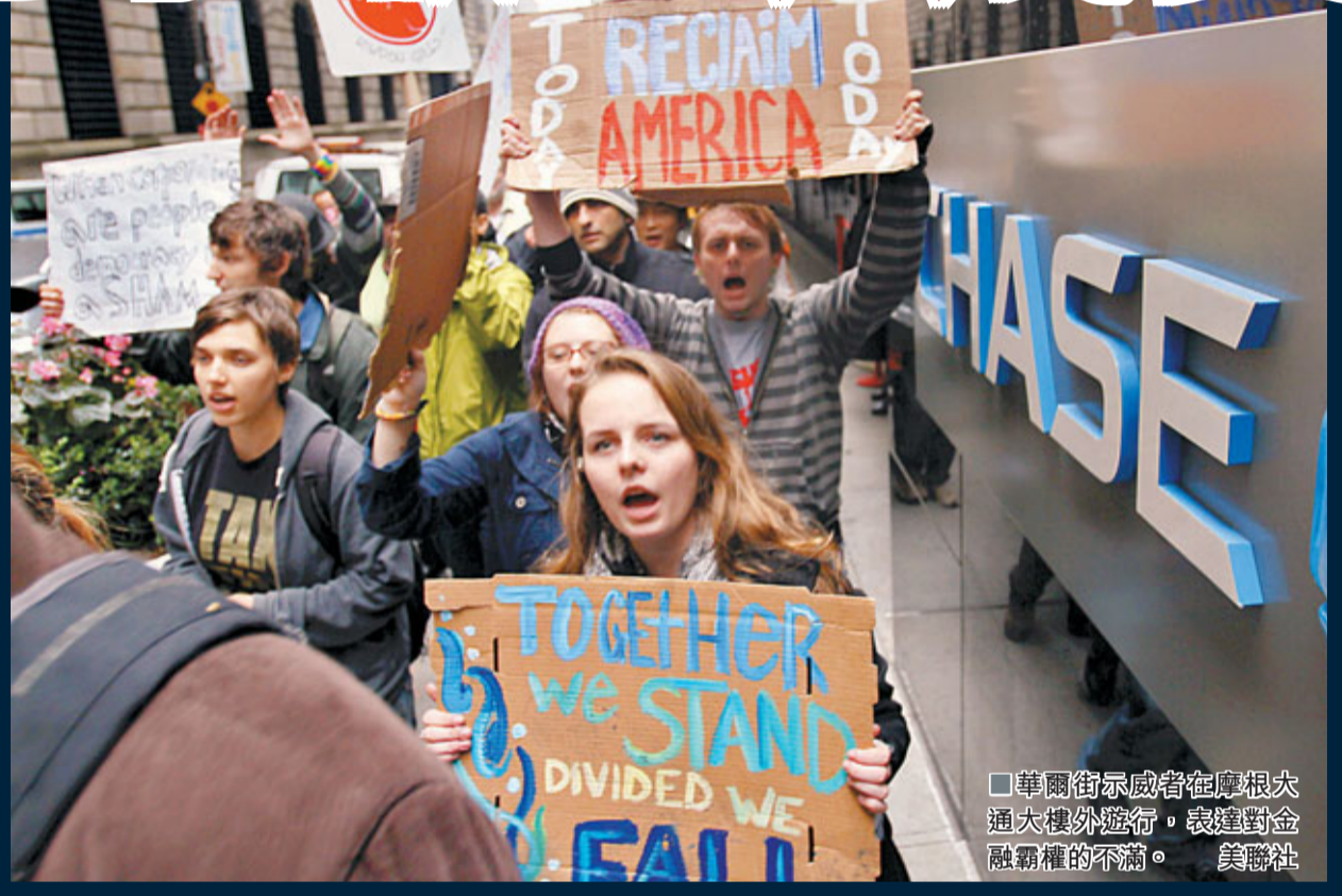
華爾街示威者在摩根大通大樓外遊行，表達對金融霸權的不滿。

美國「佔領華爾街」運動激發民眾仇富情緒，然而被針對的富人同樣怒不可遏，不少人多年來首度暫停政治捐獻，以行動抗議華府無主動打破僵局。總統競選活動如火如荼，預料兩黨籌募經費將更困難，有民主黨金主更「改變」心切，已表明轉轉撐共和黨，不利總統奧巴馬連任。