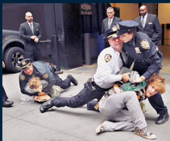
警方制服並拘捕部分示威者。