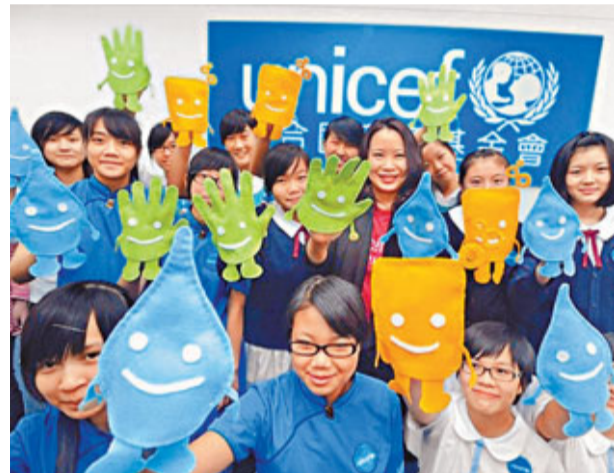
「校園洗手先鋒」由昨日起至本年底,將向區內超過20家幼稚園巡迴宣傳,教導小童正確洗手方法。

這項研究通過改造細胞的基因生長模式,製作了一個在時空有序的周期性圖案,而且這圖案是可預測及可修改的。黃建東指出,研究成果顯示了合成和定量生物學在探索生物學基本原理中的作用,長遠而言,是項研究為如何控制細胞生長成不同的結構帶來了新的突破,為幹細胞再生醫學的研究提供了一個理論基礎。他表示,雖然離造出人造器官的目標仍然十分遙遠,但起碼是一個開始,「如果成功利用幹細胞造出人工器官是第100步,現在才不過是第1步」。研究團隊由香港大學、浸會大學、美國加州大學聖地牙哥分校以及德國馬爾堡大學的研究人員所組成,由2008年起,花了3年時間研究出是項成果,並刊登於最新一期國際頂尖學術期刊《科學》(Science)之中。