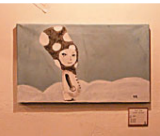
Kanki (芹琦) 作品：「一個人的世界」

當我知道畫展的主題是「活在當下」後，就想以刺女的心態畫出「一個人的世界」，刻意用上擦不掉的塑膠彩，配以冷色系，繪畫出一個孤單的小偶，它在冬日下佔據了所有視線，冷酷地觀摩着周遭沉寂的氣氛。縱然旁人會放肆地亂想着：「獨自活着的人是寂寞」，但它將從眼簾內，告訴旁人，生活是獨身，但絕對活得開心，也自在。