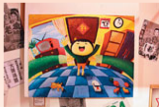
吳璋琪作品：「爸爸，抱抱！」

現在的人喜歡懷舊，好像回憶中的一切都是美好的，甚麼童年回憶、香港集體回憶等等。其實現在的種種就是將來的回憶，當我們在懷緬過去之時，也應好好地「活在當下」，為將來製造美好的回憶，才不枉此生。就如這幅作品一樣，在帶出對父愛回憶的同時，也提醒我們現在還可以做些甚麼。當我們在這一刻忙著工作與應酬時，可會想起一直在家裡默默地守護著我們的家人呢？透過「爸爸，抱抱！」這幅作品，我希望可以帶出被我們遺忘了的感動。