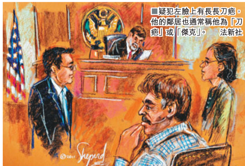
疑犯左臉上有長長刀疤，他的鄰居也通常稱他為「刀疤」或「傑克」。