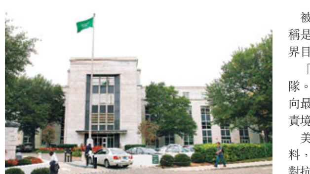
刺殺陰謀粉碎後，沙特駐美大使館未見異樣。

被指企圖暗殺沙特駐美大使的在逃疑犯，據稱是伊朗革命衛隊旗下「聖城部隊」成員，令外界目光集中在這支神秘部隊身上。