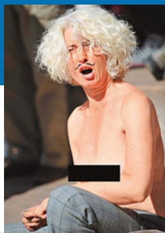
一名女示威者以無上裝參加「百萬富翁遊行」。法新社

在華盛頓，有示威者發起「佔領國會」示威，要求正就《美國就業法案》辯論的參議院盡快通過法案，6人被捕。 ■法新社/路透社/美聯社/中新社/《每日郵報》