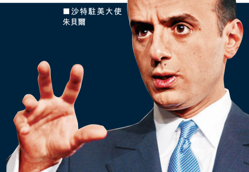
沙特駐美大使朱貝爾