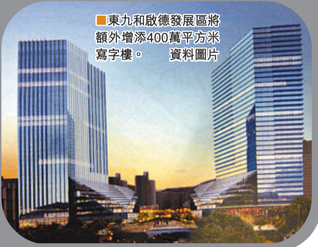
東九龍和啟德發展區將額外增添400萬平方米寫字樓。 資料圖片

香港文匯報訊(記者 羅敬文)在行政長官曾蔭權勾畫的未來規劃中，九龍東將成為新核心商業區。昨日公布的施政報告，提出未來九龍東將會提供額外樓面400萬平方米的寫字樓，當中，政府部門會率先搬往啟德發展區，騰空現有土地之餘，亦可感受優化設施。至於交通，會以單軌架空列車系統貫通區內，又會加強對外連繫。據悉，港府構思中的單軌鐵路全長約10公里，初步走線設計會連接舊區。