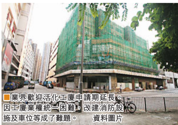
業界歡迎活化工廈申請期延長。因工廈業權統一困難，改建消防設施及車位等成了難題。

根據發展局提交給立法會的文件顯示，因活化工廈要求改裝大廈時須保留原有結構，改裝後高度及體積亦不得增加，有業界指有關要求過於嚴格，使別具創意的改裝計劃，有實際需要的改動亦無法進行。發展局遂提出容許大廈結構改動工程的範圍不多於總樓面的10%，將