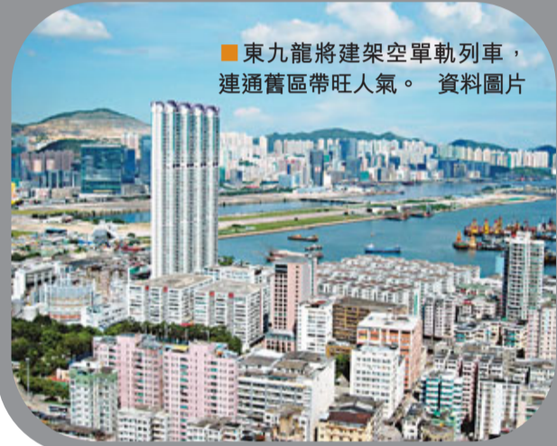
東九龍將建架空單軌列車，連通舊區帶旺人氣。