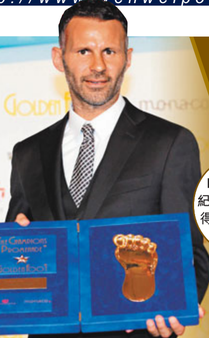
傑斯以創紀錄的票數獲得「金足獎」。

獲獎後傑斯秉承了自己一貫謙遜的作風，向恩師費格遜和曼聯隊友表達了謝意，「費格遜爵士是世界上最好的教練，他嚴苛但不失公平，在他手下踢球是一種榮譽。很幸運能擁有一位偉大的主帥、一群世界級的隊友、同時又在世界上最好的球隊中效力。」金足獎創立於2003年，只有那些多年(不小於29歲)叱吒足壇，個人和團隊成績突出且品行廣受認可的球員才有資格參加評選。曾獲「金足獎」的球員有：托迪(意大利，2010年)、朗拿甸奴(巴西，2009年)、卡路士(巴西，2008年)、迪比亞路(意大利，2007年)、朗拿甸(巴西，2006年)、舒夫真高(烏克蘭，2005年)、尼維特(捷克，2004年)、巴治奧(意大利，2003年)。