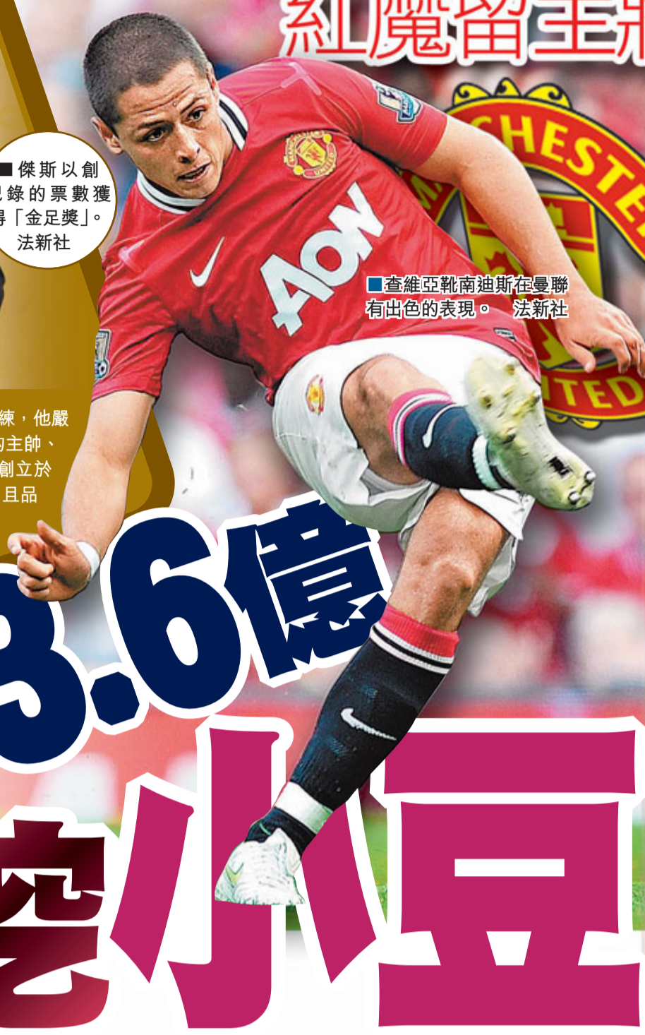
查維亞靴南迪斯在曼聯有出色的表現。