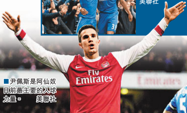
尹佩斯是阿仙奴目前最主要的球力量。