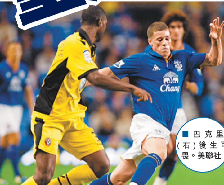
巴克里(右)後生可畏。

英國《太陽報》稱，曼聯方面希望與小豆簽訂一份周薪8萬英鎊的5年新合同。不過，皇馬主帥摩連奴卻非常欣賞這位墨西哥前鋒，並打算在冬季轉會市場向曼聯出價。報道指，若無法在冬季購入小豆，摩帥還將在明夏繼續嘗試。據悉，皇馬的出價將達3000萬英鎊(約3.6億港元)，比曼聯去夏的買入價高出2300萬英鎊之多。