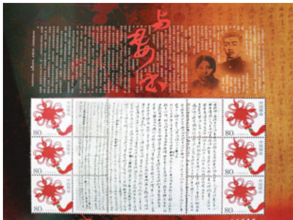
《與妻書》個性化紀念郵票在福州發行。

香港文匯報訊（記者 黃珊 福州報導）有「百年情書」之稱的《與妻書》真跡，日前化身個性化郵票在福州三坊七巷正式發售。據了解，該郵票由兩部分構成，中間是林覺民真跡《與妻書》的縮印版，左右兩邊均豎排三張一寸郵票，圖案為大紅中國結。