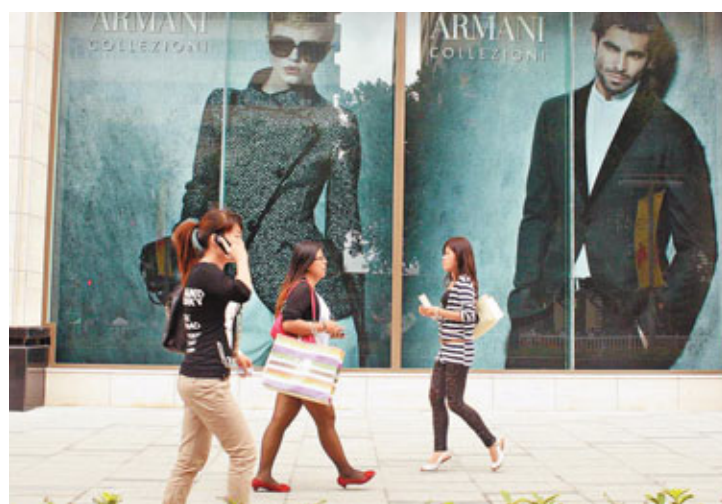
名牌手袋太貴買不起，但網上的二手正品名牌包裝紙袋也受到福州白領的青睞。

銷售員手中拿到的，即使是二手，價格亦不低。他還說，除正品紙袋受到部分人追捧外，「山寨貨」同樣大有市場，並衝擊著正品的價格。