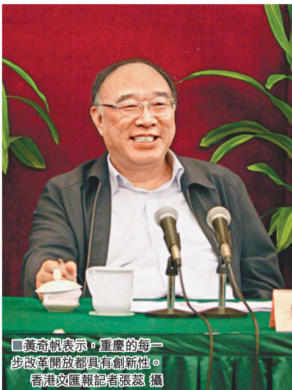
黃奇帆表示，重慶的每一步改革開放都具有創新性。

重慶在加工貿易領域取得突破，僅用兩年時間便通過建設「3+6+200」的筆記本電腦基地，將1.2億台筆記本電腦訂單帶到重慶，相當於過去20年沿海地區的筆記本電腦加工貿易總量。黃奇帆稱，未來3年，重慶將形成500多家零部件生產廠商的規模，由此形成了世界最大的筆記本電腦生產基地，該基地銷售值將達到1萬億元，相當於2010年重慶全部工業銷售值，等於3年間再造一個「重慶工業」。預計到2015年，重慶工業銷售值將達3萬億元，重慶將會成為中國電子產品的高端基地。