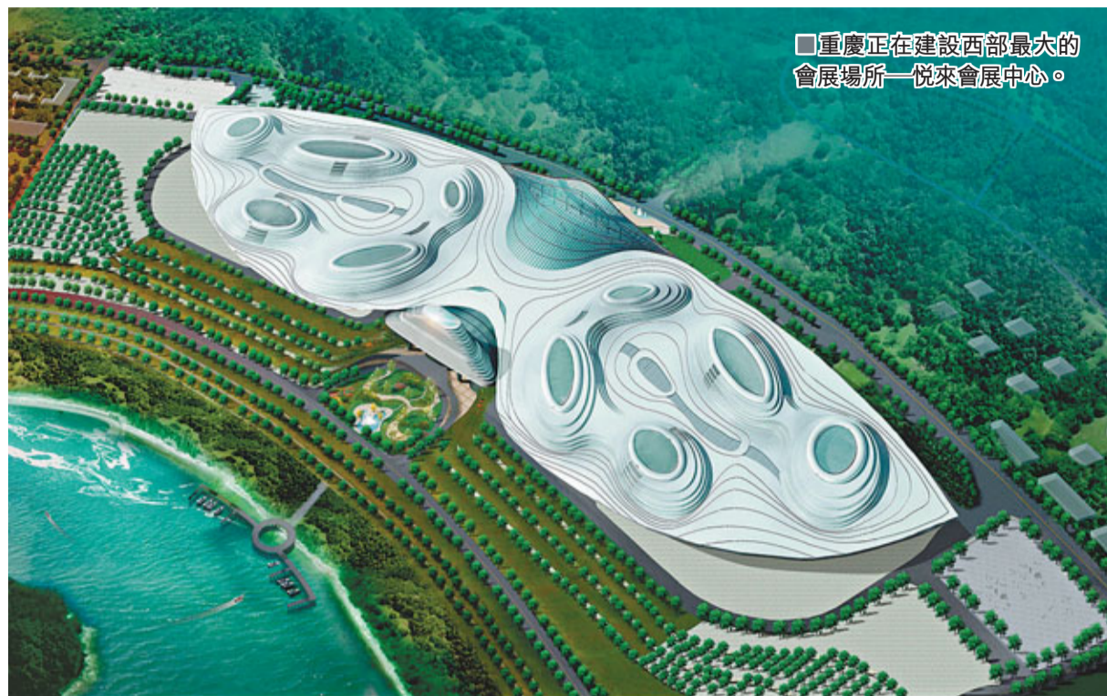
重慶正在建設西部最大的會展場所——悅來會展中心。

住房問題是貧富差距的根本體現。為了讓百姓「住有所居」，實現「宜居重慶」目標，重慶去年啟動雙軌制住房改革，投資2,000億元開建4,000萬平方米公租房，覆蓋200萬住房困難人群。此外，重慶政府出資鼓勵百姓自主創業，大力發展微型企業，並給予5萬元的一次性補貼和稅費優惠，1年多發展4萬餘微