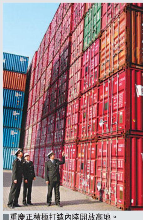
重慶正積極打造內陸開放高地。

重慶市長黃奇帆特別強調，近年來，重慶致力於打造全球筆電基地、內陸開放高地，在國家有關部門大力支持下，對從重慶經新疆至歐洲的「渝新歐」鐵路線路進行優化，形成了具有「新絲綢之路」美譽的「渝新歐」國際鐵路聯運大通道。以往，從重慶運往歐洲的貨物大都需要先運往沿海，再轉口歐洲，而「渝新歐」鐵路改變了中國傳統的「一江春水向東流」的運輸格局，對重慶建設「內陸口岸高地」具有里程碑意義。據黃奇帆介紹，從重慶出發，通過「渝新歐」鐵路到俄羅斯、波蘭、荷蘭、德國等國家僅需要12至13天，而從東部沿海輪渡至歐洲卻要36天，因此許多跨國公司把重要的貨物通過重慶運往歐洲，許多歐洲的企業也在通過「渝新歐」鐵路把貨運向中國。自此，重慶已成為內陸開放口岸與中歐貿易的橋頭堡。