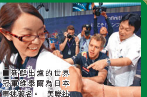
新鮮出爐的世界冠軍維泰爾為日本車迷簽名。

維泰爾的下一個目標將是在本周末的韓國大獎賽上，爭取為紅牛車隊奪得年度車隊總冠軍。