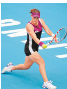
美網冠軍、澳洲女網球手斯托瑟(見圖)與俄羅斯名將施禾娜莉娃日前正式攜手晉級WTA年終賽，至此年終賽8個名額已有7席塵埃落定。除斯托瑟和施禾娜莉娃外，世界排名第一的禾絲妮雅琪、俄羅斯美女舒拉寶娃、溫網冠軍基維杜娃、世界排名第4的阿薩蘭卡及法網冠軍李娜都取得參賽資格，德國球手柏高域、波蘭球手拉雲絲絲和法國的巴圖莉將爭奪最後一席。