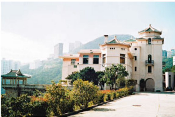
■何東花園的主樓，呈現了「中國文藝復興」風格。