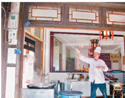
■「黃龍溪一根麵」製作過程