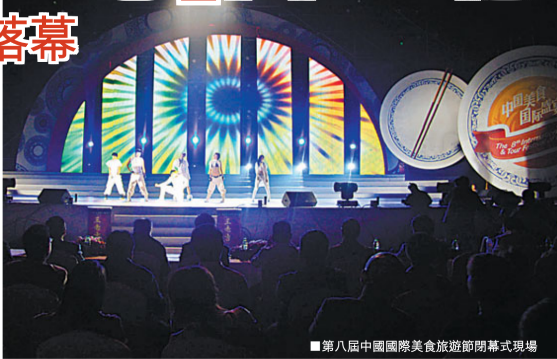
■第八屆中國國際美食旅遊節閉幕式現場