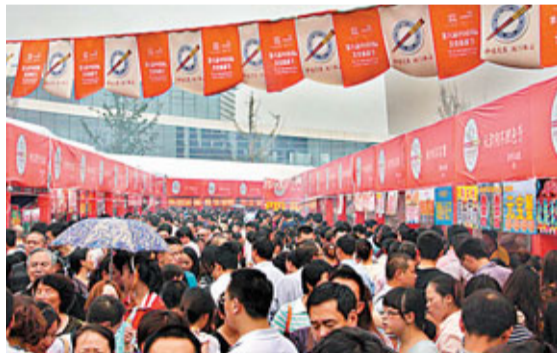
■美食節期間如織的人流

香港文匯報訊（記者 唐鑑宇 成都報道）11天，直接營業收入約4.3億元……這一系列令人心動數字背後，彰顯出的，是第八屆中國國際美食旅遊節的巨大成功。10月8日晚，伴隨著「美食寶貝」們的動人舞姿以及「好吃嘴」的幾分不捨，第八屆中國國際美食旅遊節在成都非物質文化遺產博覽園順利閉幕。經過八年的艱苦努力，國際美食節如今已成為海內外眾多食客翹首以盼的年度美食盛宴。通過八年的悉心探索，國際美食節如今已形成了「政府引導、社會參與、市場運作」的辦節模式，以政府資金作為引導，撬動社會資源和資本參與，產生了明顯的倍增效應。「中國美食、國際盛宴」，以一年一度中國國際美食旅遊節為契機，成都立足自身的「美食文化」，充分利用「美食之都」這一觀麗的城市名片，正逐步走出了一條美食產業的特色發展之路。