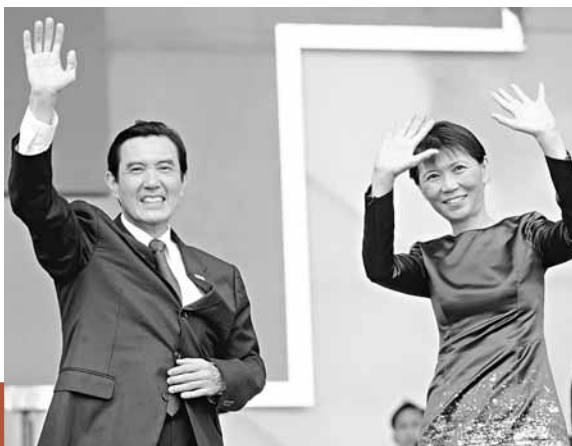
■馬英九(左)與夫人周美青(右)在向全場觀眾熱情揮手致意。