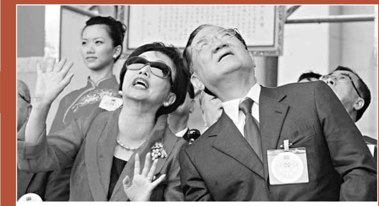
■神龍小組表演高空跳傘，成功空降凱道，讓觀禮的賓客大開眼界。中央社