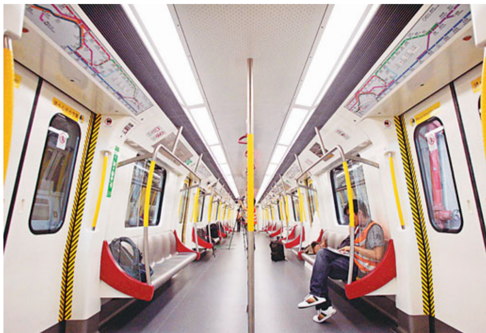
港鐵內地製新列車，車廂空間感比舊款增加。