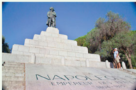
法國科西嘉島上的拿破崙雕像。