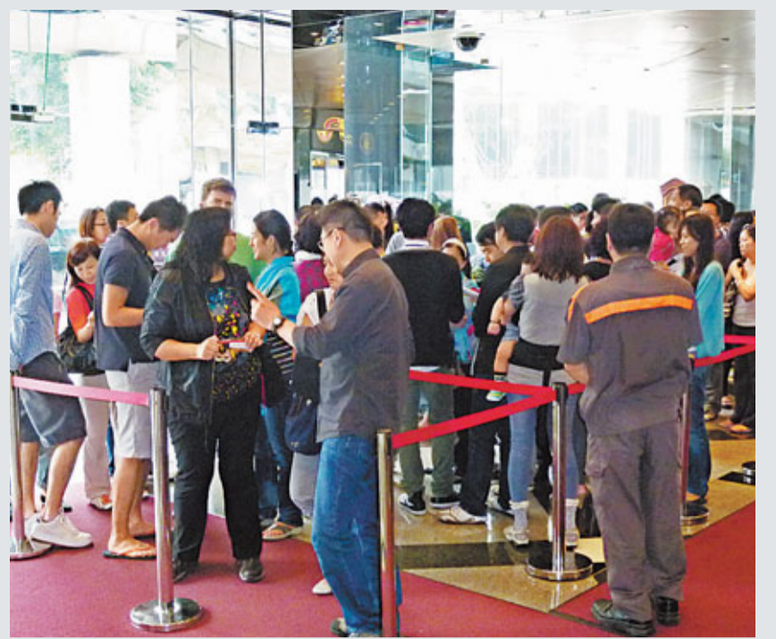
深灣9號示範單位續吸引不少準買家到場參觀,示範單位外人氣旺盛。

珀麗灣一個兩房戶,業主於一個月內減價31.2萬元。中原地產梁曉陽表示,珀麗灣29座中層A室,面積622平方呎兩房戶,以316.8萬元易手,呎價5,093元,較市價低約5%。業主於上月以348萬元放售單位,一個月內減價31.2萬元,現獲利102.6萬元,升值47.9%。