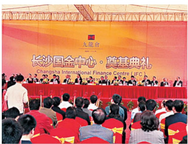
長沙國金中心奠基儀式現場。

香港文匯報訊(記者 鄧鵬 長沙報導) 規劃設計452米的長沙國金中心項目日前在長沙芙蓉區中央商務區核心位置奠基,由香港九倉集團投資的該項目將刷新湖南省建築高度的新紀錄。