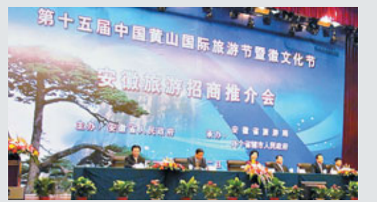
安徽旅遊招商推介會共19個旅遊項目簽約,涉資逾300億元。

長沙國金中心項目位於長沙芙蓉中央商務區核心位置,淨用地111.5畝,規劃建設大型精品商場、高層寫字樓及國際白金五星級酒店於一體的超大型城市綜合體,項目計劃於2016年全部建成。據悉,奠基的長沙國金中心將創造湖南省商務地產三「最」,即建築最高;面積最大;總建築面積98萬平方米,其中商場面積25萬平方米;產業定位最高,項目將匯聚金融、消費、商務功能於一體,成為湖南高端現代服務業新的匯聚點。