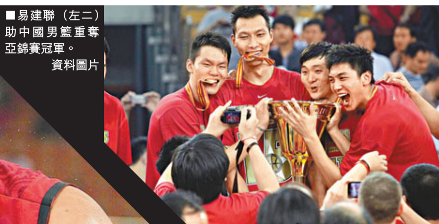
易建聯(左二)助中國男籃重奪亞錦賽冠軍。資料圖片

易建聯 (Yi Jianlian) 出生日期：1987年10月27日 出生地：廣東鶴山市 身高：2.13米 (7英尺) 體重：116公斤 (258磅) 司職：小前鋒，大前鋒或中鋒 職業生涯：2002年，15歲進入CBA，效力於廣東宏遠隊 2004年，入選中國國家男子籃球隊 2005年，成為CBA史上最年輕的MVP 2007年，NBA選秀以第一輪第六順位被密爾沃基公鹿選中 2008年，轉會至新澤西網隊 2010年6月30日，轉會至華盛頓巫師隊 2011年10月8日，易建聯重回CBA為廣東效力