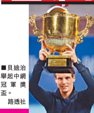
貝迪治舉起中網冠軍獎盃。

香港文匯報訊 (記者 陳曉莉) 2011 賽季中國網球公開賽 9 日在北京國家網球中心鑽石球場落下帷幕，捷克好手貝迪治與波蘭的拉雲斯卡分挫比歷克 (克羅地亞) 及柏高域 (德國) 稱王封后。不過由於諸多星級球手因傷退賽或提前出局，今年的中網似乎份量不足。據中網網壇消息，坐落在北京奧林匹克公園的鑽石球場 8 月份剛剛竣工，這座耗資巨大、豪華異常的球館本期待藉着中網火爆一把，但事與願違。由於柏高域、小威廉絲等大牌球手因傷沒來，李娜、伊雲妮等極具號召力的球手又提前遭淘汰，鑽石球場始終不夠閃亮。