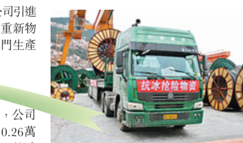
■漢纜股份積極投入慈善事業

電纜用保護層墊，此技術完全符合電纜工藝要求，每年可以將產生的廢塑料全部利用，節約費用100餘萬元，實現了電纜絕緣材料的無損耗生產。