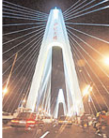
斜拉橋，橋面寬29.8米，兩側設人行道。

離開度假區外出遊玩，可以看看海口世紀大橋夜景迷人，是海南省海口的標誌性建築——海口世紀大橋八月初開通以來，成為海口一道風景。大橋全長2663.606米，其中主橋長636.60米，主橋為雙塔雙索面三跨連續預應力混凝土橋。大橋全長