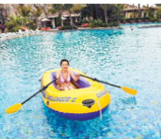
■大家可以泛舟泳池上，非常寫意。