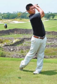
■資格教練於水悉心教導，大家輕易掌握打高球的技巧。