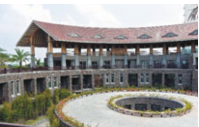
■在水療主樓內，你可嘗試海南特色之一的海貝熱能按摩護理，感覺舒服。

引，一棟棟的圓頂水療主樓正是以聯合國遺產的客家土樓為靈感設計，特顯以歷史融合中國建築藝術的特色。於這個富有土樓特色的水療中心內，你可感受以海南地道材料創製的水療護理，讓自己鬆弛神經，由內而外感受東方夏威夷氣息。