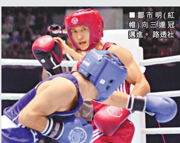
鄒市明(紅帽)向三連冠邁進。路透社