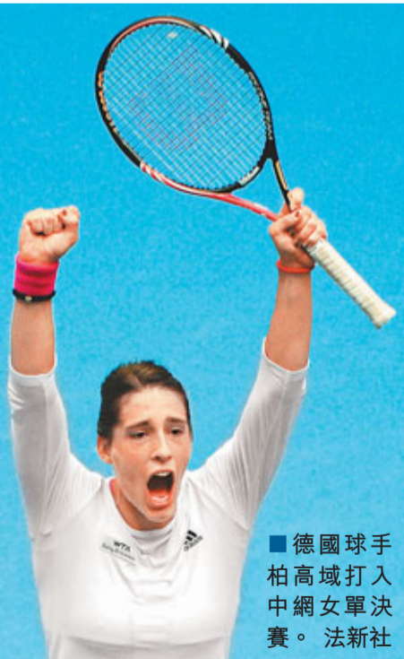
德國球手柏高域打入中網女單決賽。