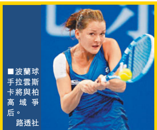
波蘭球手拉雲斯卡將與柏高域爭后。

比歷克將在決賽遭遇同身為發球高手的貝迪治，後者以6:4、4:6、6:1打敗加晉級。