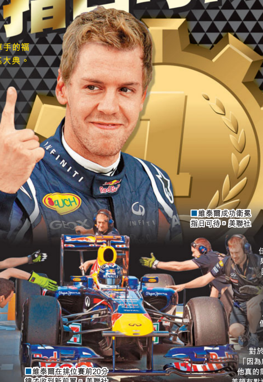
維泰爾在排位賽前20分鐘才收到新前翼。

畢頓：已發揮極致 畢頓在日本站3次練習中均做出最快圈速，可惜在排位賽最後一圈以0.009秒之差，錯失今季首次頭位出賽的機會，賽後畢頓語帶失望說：「只是(差)0.009秒，但這還是不夠好。我感到我已將戰車發揮到極致，要對車隊公平一點，能夠在紅牛車隊福地與他們爭鬥，車隊已做得很好。紅牛過去2年均在這裡稱雄，但我們明日(今日)也可有一場好比賽。」