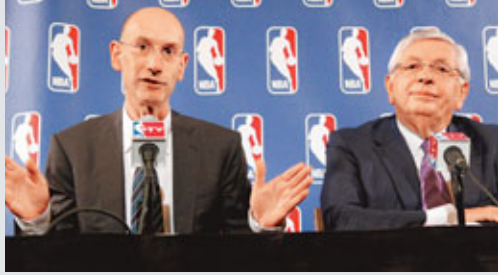
NBA總裁斯特恩(右)曾指周一若未達成協議，常規賽將被迫縮減。

球員工會曾請求球隊班主在10月10日前再次談判，後者雖同意恢復談判，但附加一個前提條件：球員必須接受五五分賬與籃球相關的