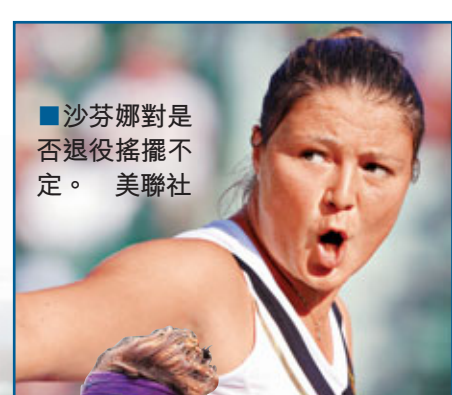
沙芬娜對是否退役搖擺不定。