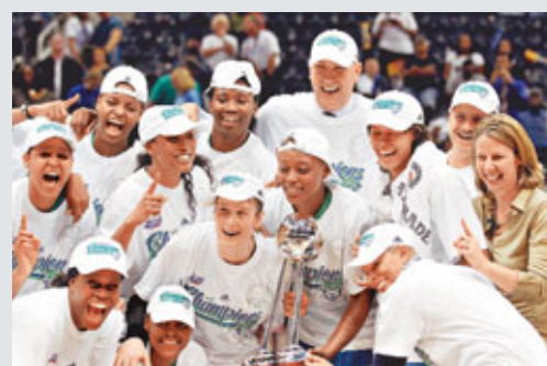
山貓橫掃夢隊奪冠。

WNBA美國女子籃球聯賽則完美畫上句號。明尼蘇達山貓周五在總決賽第3場，作客以73:67擊敗亞特蘭大夢隊，以3戰全勝姿態首奪WNBA總冠軍。3年前成立的夢隊是WNBA最年輕的球隊，今次已是連續第2年打進總決賽，可惜兩度躋身總決賽均與總冠軍失之交臂。