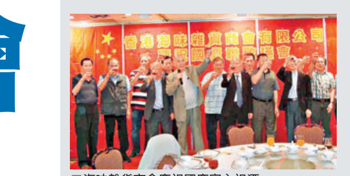
■海味雜貨商會慶祝國慶宴會祝酒。

蘇樹輝代表何鴻燊博士及公司全人，向全國同胞致以問候及祝願。他表示，澳門作為中國的一個特別行政區，在國家日益富強的同時亦一同沾上福氣，而澳博和員工一直本着「取諸社會，用諸社會」的態度來