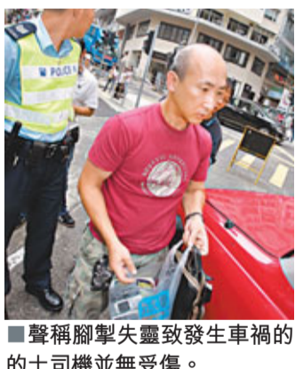
肇事的士內有多部手提電話。聲稱腳掣失靈致發生車禍的士司機並無受傷。