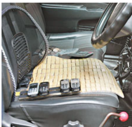
肇事的士內有多部手提電話。