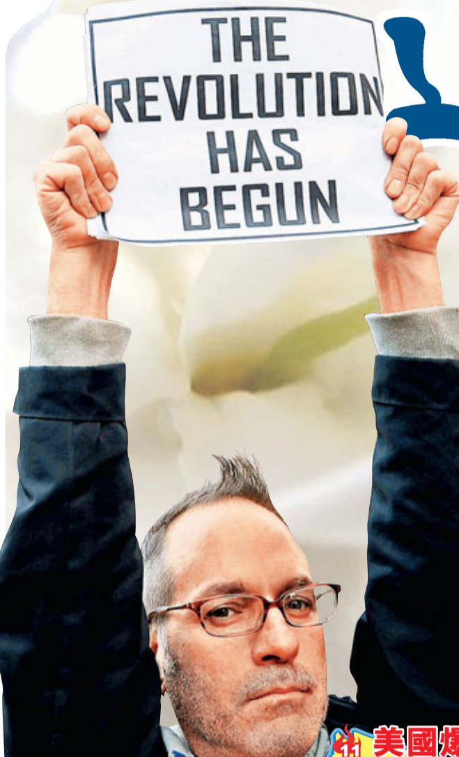
響應「佔領華爾街」抗議活動，美國上千名示威者進軍首都華盛頓。左圖為紐約示威者高舉「革命爆發」標語。