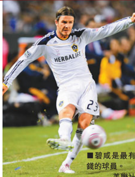
■碧咸是最有錢的球員。

分，每得一分的代價是1510516英鎊。 車路士則從2003年艾巴莫域治入主起算，至今拿到的680個英超積分，每一分的代價是1406617.65英鎊。而曼城自從2008年曼蘇爾入主後，每拿一個英超積分的花費是2257526.88英鎊。 全球球員碧咸最有錢 另外根據統計，足球世界裡最有錢的人，是曼城老闆曼蘇爾，其財富有200億英鎊。碧咸是最有錢的球員，財富達到1億3千5百萬英鎊，卡比路則是最富有的主帥，個人財富為3800萬英鎊。