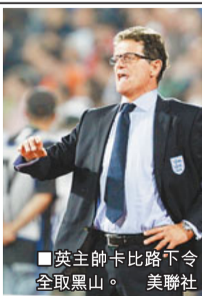
■英主帥卡比路下令全取黑山。

卡比路慣用的前鋒朗尼、戴倫賓特，以及安祖卡路爾都將被推上前線，在曼聯冒起很快的韋碧克及再次被召喚的森莫亞亦將會在鋒線上競爭上陣的機會。艾殊利楊格、禾確特和林柏特在對黑山的賽事中擔起英格蘭隊的進攻重任。