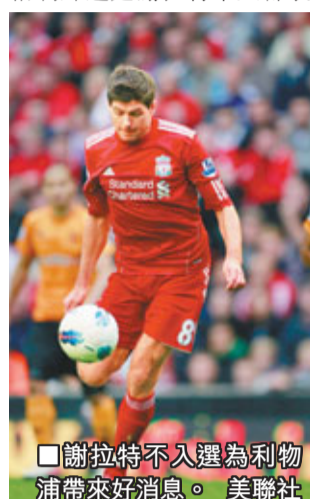
■謝拉特不入選為利物浦帶來好消息。