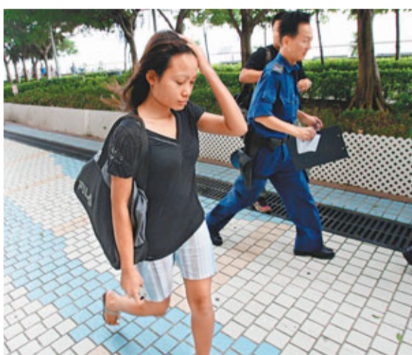
■無法阻止少女離家蹈海的菲傭事後向警方提供資料。