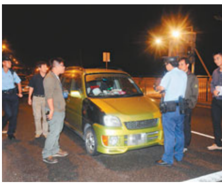
■警方在士美菲路燈口將涉嫌爆竊案私家車截獲。

昨凌晨2時許，特遣隊便裝警員發現一輛可疑私家車，停泊於皇后大道西335號一食肆門外，有2名男子強行打開店舖門闖進店內，警員懷疑有人進行爆竊，於是現身衝入店內，將店內正在搜掠的2名男子拘捕，有警員擬上前調查停在食肆外的私家車時，車上2男女見狀，立即駕車逃走，警員遂通知上級派附近警車追截，私家車逃奔1,500米，從皇后大道西轉入堅尼地城海傍，再駛至士美菲路交界處交通燈位前，終被警車截停，警方當場拘捕車上2男女，