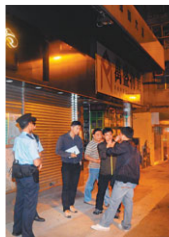
■警員在遭爆竊的餐廳調查。

香港文匯報訊(記者 杜法祖) 四人幫「爆竊黨」趁假期店舖大做生意，未能將大筆營業款存入銀行，昨凌晨在西環爆竊一間食肆，惟遭反爆竊隊警員撞破，2名男子當場被捕，另2名女駕私家車逃走1,500米，亦被警車截停拘捕，起出爆竊工具，警方正調查該「爆竊黨」是否涉及區內多宗同類案件。