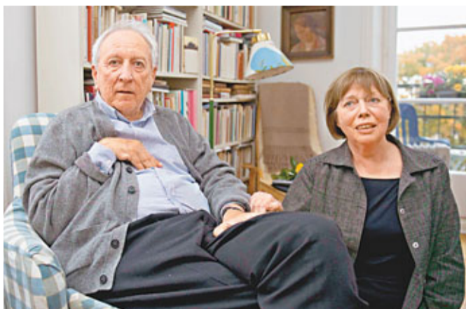
■特蘭斯特勒默與妻子喜聞得獎消息。