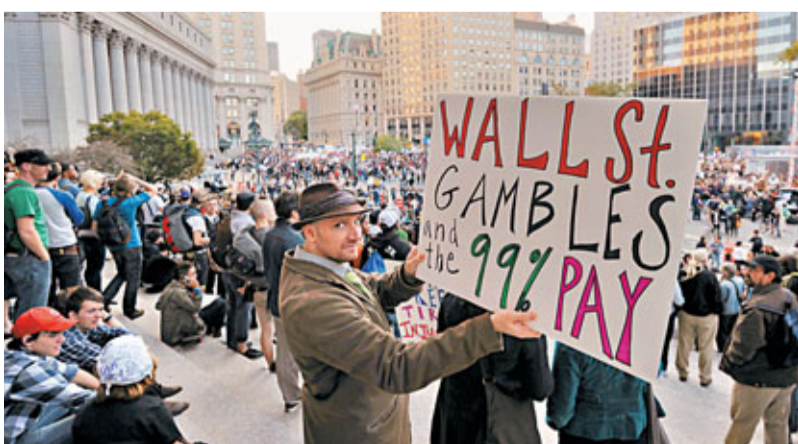
曼克頓示威者人山人海。

美國民眾自9月17日發起的「佔領華爾街」反企業示威，規模不斷升級。多個工會前日加入聲援，至少5,000人湧到曼克頓下城區的富利廣場，會連日來在祖科提公園露宿的示威人士，一同遊行至華爾街，是兩星期以來最大規模的遊行示威。在美國其他城市，亦出現較小規模的遊行及學生示威。