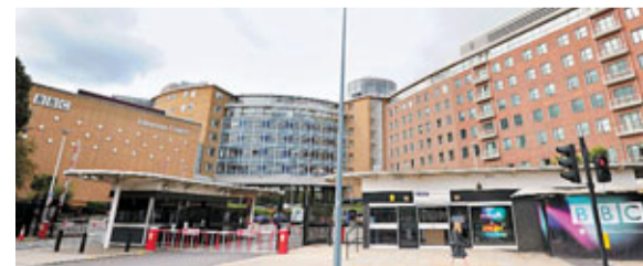
BBC計劃出售電視大樓。

（約1,753港元）的牌照費，亦分擔政府額外開支，自行承擔BBC全球服務（BBC World Service）經費。倫敦西敏寺大學傳播學系教授巴尼特表示，在國家現時經濟狀況下，眾人都努力削減，BBC真無旁貸。分析指BBC「瘦身」有助平衡現時公營媒體強於私營企業的競爭局面。