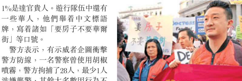
紐約華人參與「佔領華爾街」運動。

遊行人士打鼓吶喊，高舉寫上「公平！民主！改革！」、「捍衛我們的共和國」的標語牌，並高呼「我們是99%中的一員！」意指他們是普羅大眾，而那少數的