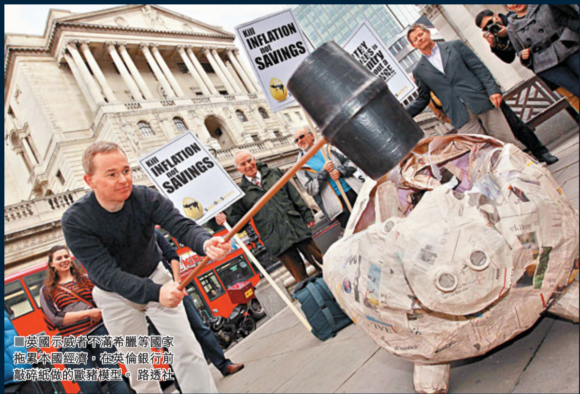
英國示威者不滿希臘等國家拖累本國經濟，在英倫銀行前敲碎紙做的歐豬模型。