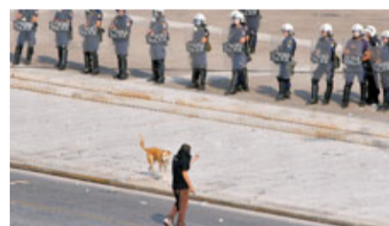
雅典示威者與警方對峙。

希臘公務員及學生前日舉行全國大罷工，抗議政府實施嚴厲的財政緊縮措施。約2萬名示威者在雅典國會大樓外抗議期間，部分無政府主義者向警察投擲燃燒彈，警方施放催淚彈驅散。事件中至少4人受傷，包括2名警察，另有2名攝影記者採訪示威時受傷，其中1人報稱拍攝攝影員毆打倒地的示威者時，被防暴警察用盾牌擊中面部。警方表示拘捕10多人。