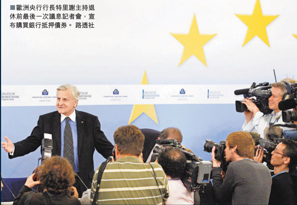
歐洲央行行長特里謝主持退休前最後一次議息記者會，宣布購買銀行抵押債券。