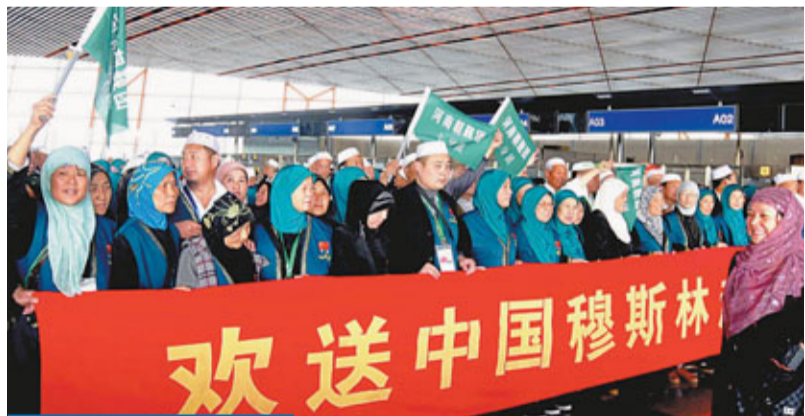
穆斯林啟程朝覲 10月6日，2011年度中國第一批朝覲人員乘包機離開北京赴沙特麥加，此次共有13700餘名朝覲人員赴沙特。

該中心主要職能是在科技創新、湖泊治理、清潔能源、生態城市建設、新能源等領域為無錫提供人員培訓和科研創新，無錫將分享芬蘭在上述領域的先進技術、經驗和專業知識。