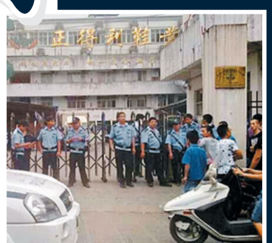
溫州正得利老闆9月27日跳樓身亡後,溫州資金鏈斷裂事件越揭越烈。

在江浙一帶,企業主的賭博現象非常普遍,除了近年來頻頻傳出的企業主聚眾、赴澳門等地賭博外,近期又興起內地的網絡賭博。消息人士透露,網絡賭博在溫州本土及在外溫商中較為常見,其既滋生了社會以此為生的中介人員,又導致了企業主直接的負債逃逸,最後累及民間借貸鏈,成為民間借貸鏈斷裂的催化劑。