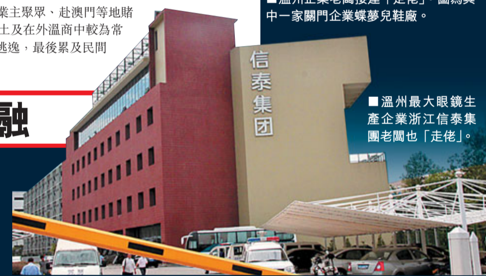
溫州最大眼鏡生產企業浙江信泰集團老闆也「走佬」。

據悉,溫州48家融資性擔保公司發出倡議為企業提供低保費的擔保,同時銀行機構為企業提供較低利率的貸款。目前已經有兩家銀行爭取到8億元的貸款額度。