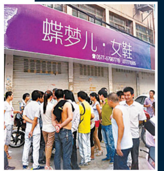
溫州企業老闆接連「走佬」。圖為其中一家關門企業蝶夢兒鞋廠。