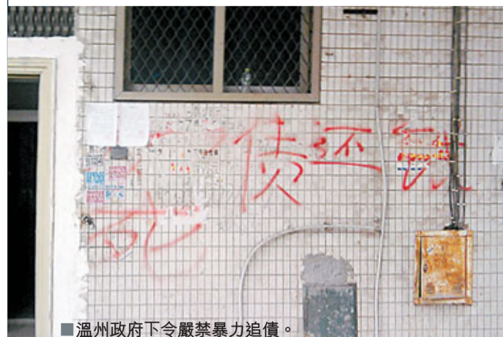
溫州政府下令嚴禁暴力追債。

香港文匯報訊 為防止溫州老闆「走佬潮」的連鎖反應加劇,溫州有關部門已展開行動,一方面嚴禁暴力討債、追債;另一方面則向銀行派駐工作組,要求銀行方面不抽資、不追債。