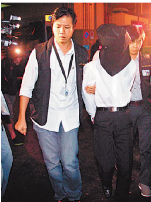
■涉盜用顧客信用卡資料網上購物的酒樓工人被押返家搜屋。

黃志明高級督察透露，初步調查，相信疑犯是利用工作之便，盜取「碌卡」消費顧客的信用卡資料，先記下顧客信用卡號碼、卡主姓名及有效日期等資料，之後透過網上交易平台，利用受害人信用卡資料向商號訂購iPhone及iPad等易於變賣現貨的產品。警方相信疑犯在去年7月開始犯案，但目前僅接獲4至5宗投訴，涉及金額2萬多元，不排除仍有其他受害人並未報警。