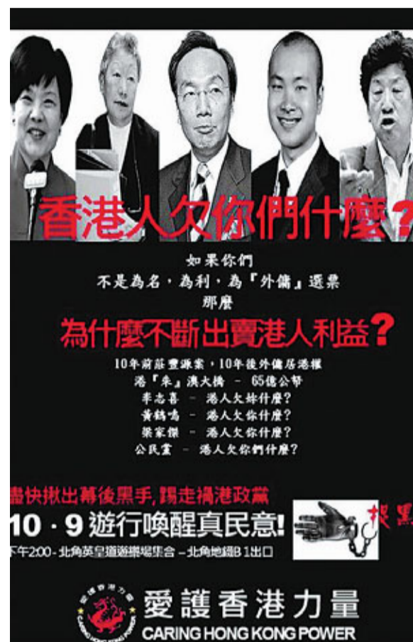
■有網民自製海報，呼籲市民周日(9日)上街，表達對「禍港黨」的不滿。網上圖片

「hkD新牌仔」揶揄該黨揚言捍衛法治，其實是為了「選票」：「2008年的立法會選舉，公民黨得票20萬，若果在香港已居住滿7年的12.5萬外傭擁有居港權，公民黨的得票可能從20萬增加到32.5萬；若果在香港已居住滿7年外傭連同他們的家屬都擁有居港權，公民黨的得票可能遞增到60萬。」「Realheart」說：「就因為佢哋太卑鄙無恥，禍港殃民，大家一定要站出來，話俾佢聽聽，香港人唔係俾仔！」