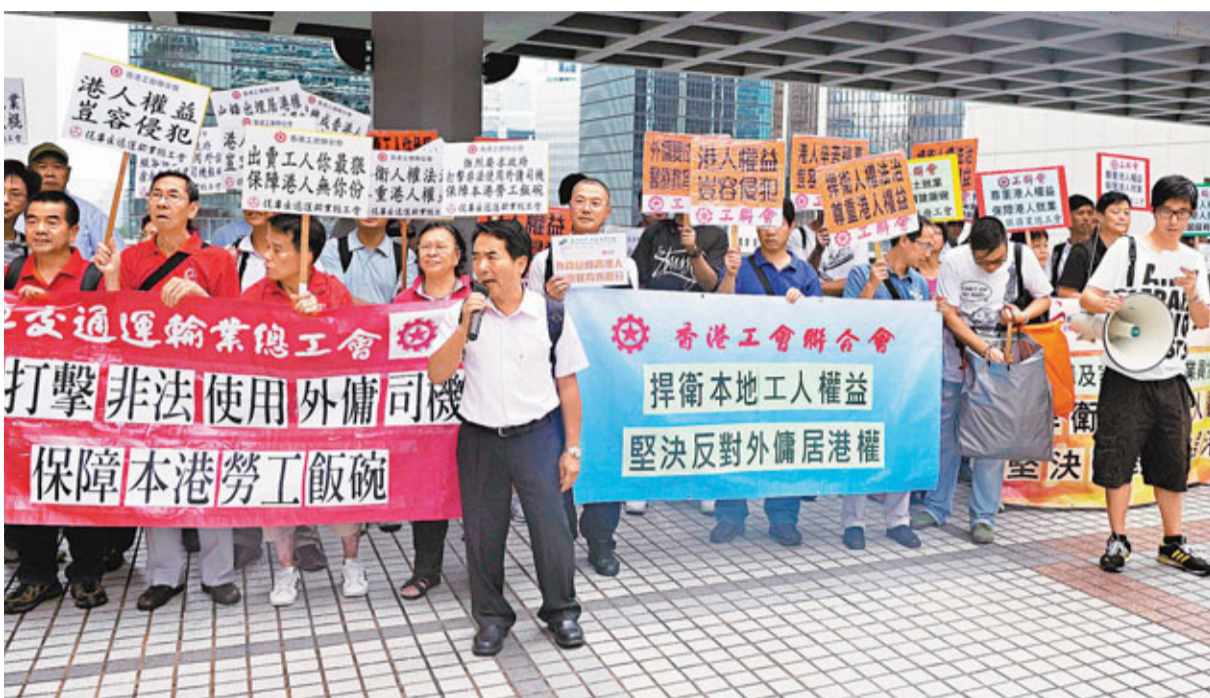
■工聯會下周一舉行反外傭居港權簽名活動。圖為該會日前示威，促請當局保障本港勞工權益。

政府亦不滿法庭未有考慮香港在回歸前後，中英政府已界定外傭為「非通常居住」的類別，亦制定相關政策維護這一個決定，認為法庭應考慮中英聯合聲明，以及1999年人大釋法，都賦予香港立法機構能夠依據《基本法》第24條，行使權力決定哪一類人士為「通常居住」，包括能夠將外傭排除於這一個組別之外。