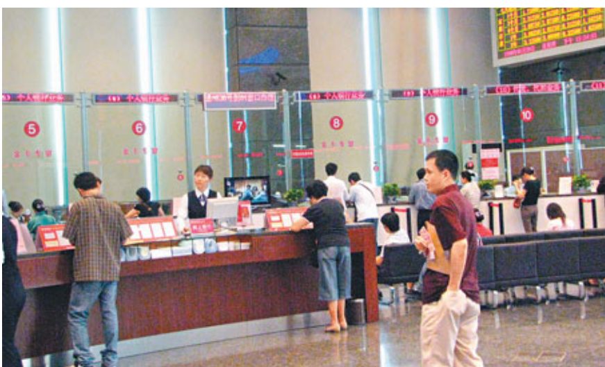
■為過考核關,深圳有銀行職員以日息1%吸納資金。

存款、貸款平穩,要求銀行9月30日的存款餘額與10月8日的存款餘額不能相差超過0.5%。這就意味着,在這期間銀行的存款和貸款都不允許出現大的波動。但是,許多銀行早在9月30日的前十天甚至