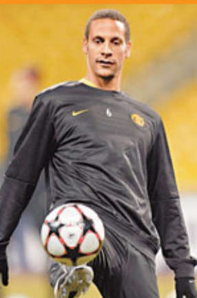
李奧費迪南已無復昔日勇態。

碧咸與美職足球隊洛杉磯銀河的合約將於下月屆滿，包括昆士柏流浪、熱刺以及布力般流浪等幾支球隊，都有意向「萬人迷」招手，邀他重返英超。儘管這位36歲中場球星有意重返英超，保持比賽狀態以選明年奧運會大軍，然而據傳法甲富豪球會巴黎聖日耳門或隨時可邀得碧咸加盟。聖日耳門的體育總監李安納度上月已表明，在昔日執教意甲AC米蘭時跟勁力過其麾下的碧咸關係甚佳，故有信心可簽下「萬人迷」。