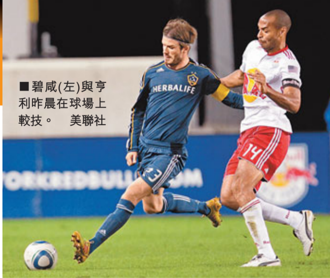
碧咸（左）與亨利昨晨在球場上較技。