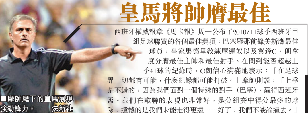
摩帥麾下的皇馬展現強勁鋒力。