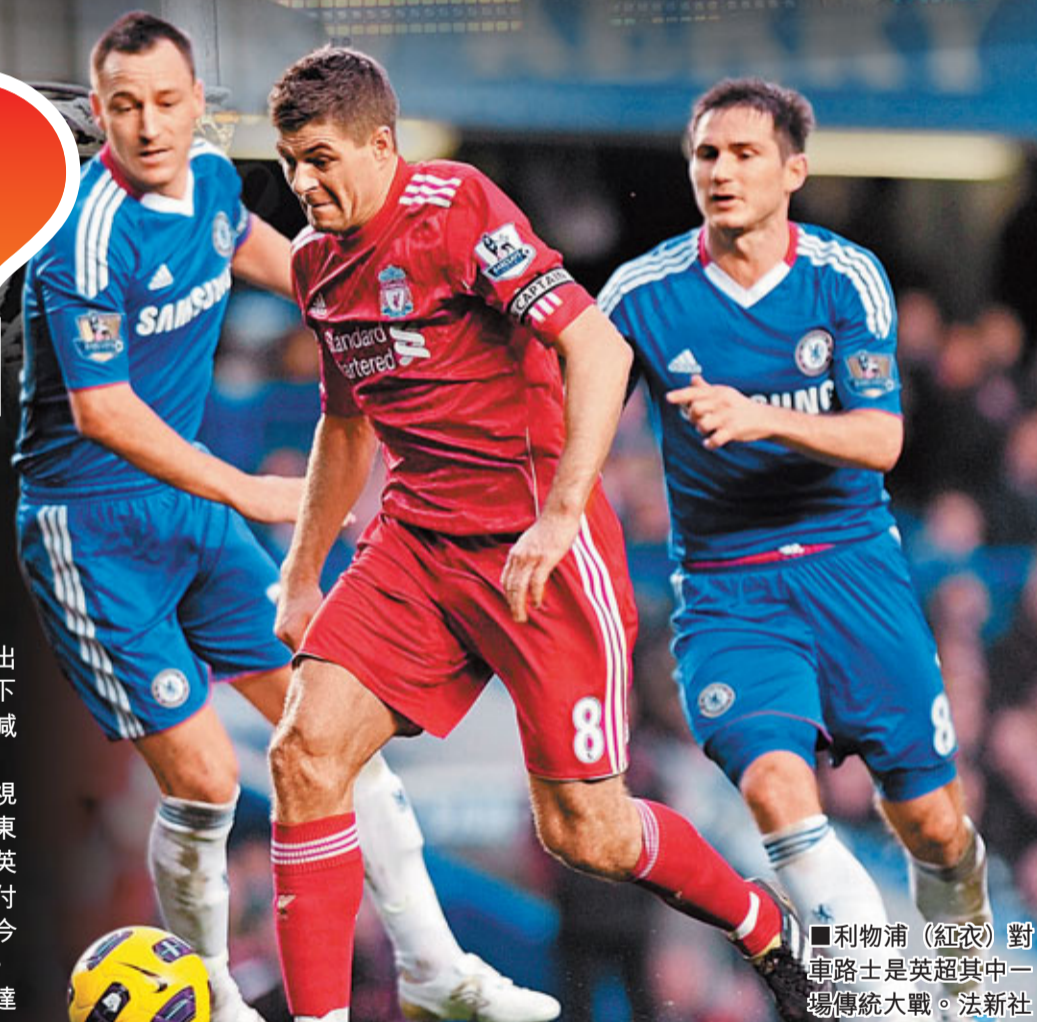
利物浦（紅衣）對車路士是英超其中一場傳統大戰。