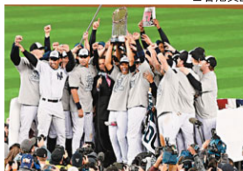
美職棒勁旅紐約揚基。