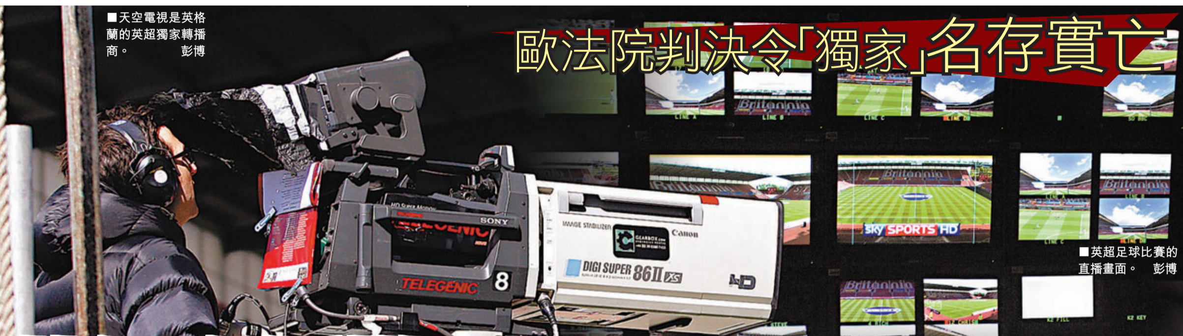
英超足球比賽的直播畫面。